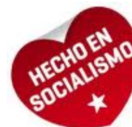
Imagen País: Venezuela

Con este escenario sin duda que la imagen país se concentra en los siguientes factores diferenciales negativos: vulnerabilidad económica; baja eficacia gubernamental; obstáculos para