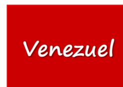
Imagen 20. Marca País: Venezuela

A esto se suma en la actualidad, el Ron de Venezuela (situado entre el octavo o noveno lugar en el mercado mundial), reconocido como Denominación de Origen Venezolana, un sello de calidad, reputación, confianza y aceptación Universal. 47