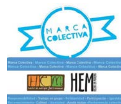
Imagen 2. Marca colectiva: Hecho en moreno

La marca colectiva es considerada por la doctrina argentina como “una categoría de derecho intelectual nuevo, sin precedentes legales”, la cual tiene un doble contenido patrimonial y social. “Patrimonial” por cuanto pretende valorizar los productos o servicios que diferencia. Y “social” debido a que dichos productos o servicios pertenecen a agrupaciones o formas asociativas de la economía social. De ahí que, la función legalmente reconocida es diferenciar la pertenencia a una asociación por parte del fabricante o prestador del servicio. 15 Un ejemplo de uso de marca colectiva en Argentina es “Hecho en Moreno” (Imagen 2).