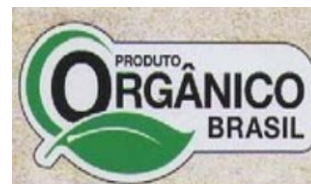
Imagen 14: Sello SISORG

Producto Orgánico Brasil o “Sello SISORG” (imagen 14), es creado por el Ministerio Agricultura, Pecuário y Abastecimiento, dentro del programa sobre el Sistema Brasileño de Validación de Conformidad Orgánica (SISORG), para ser utilizado, a partir del año 2011, con carácter obligatorio, por aquellos productos orgánicos que entren en el mercado nacional.