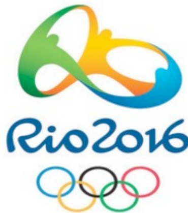
Figura 2 – Exemplo de marca mista 12

A marca mista, por sua vez, “é aquela que combina elementos nominativos e figurativos, ou aquela em que a grafia do elemento nominativo seja apresentada de forma estilizada” (COPETTI, 2010, p. 66). Nessas, a proteção recai sobre os elementos nominativos e figurativos em seu conjunto (Figura 2).