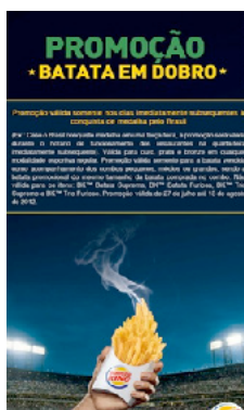
Figura 8 – Caso Burguer King nos Jogos Olímpicos Londres 2012

Não obstante, a imagem desenvolvida para a peça publicitária constituiu outra infração, pois a batata frita do Burguer King fazia alusão à tocha olímpica, símbolo de propriedade do COI que só pode ser utilizado pelos patrocinadores oficiais (Figura 8). O McDonald's, então detentor dos direitos oficiais de associação aos Jogos, denunciou a ação do concorrente ao Comitê, que decidiu investigar o caso. A decisão do órgão, contudo, não foi divulgada publicamente.