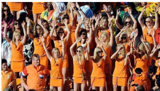
Figura 7 – Caso Bavaria na Copa do Mundo FIFA de Futebol de 2010

O terceiro caso ocorrido na Copa do Mundo FIFA de Futebol de 2010 envolveu as marcas de cerveja Bavaria, empresa holandesa não patrocinadora oficial, e Budweiser, patrocinadora oficial da competição (PORTUGUAL, 2014). Na partida entre Holanda e Dinamarca, a Bavaria investiu em uma campanha parasitária ao inserir na torcida trinta e seis jovens modelos, todas usando vestidos da cor laranja e portando pequenas bandeirolas com o logotipo da marca, as quais roubaram a cena durante a partida (Figura 7).