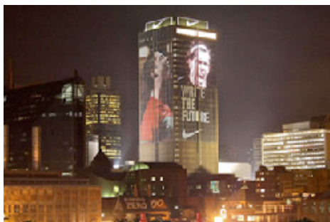
Figura 6 – Caso Nike na Copa do Mundo FIFA de Futebol de 2010

Como era de se esperar, a campanha foi um sucesso e serviu para ofuscar, ou ao menos para neutralizar, os resultados da Adidas enquanto detentora dos direitos de exclusividade do evento. Em virtude do acesso por meio das mídias e redes sociais, a propaganda da Nike foi vista por mais de vinte milhões de pessoas (OFEK, 2010).