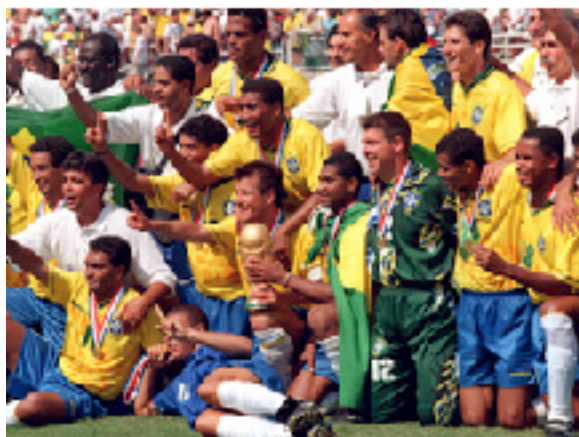
Figura 4 - Caso Brahma na Copa do Mundo FIFA de Futebol de 1994

A Brahma, buscando expor sua marca de outra forma, investiu US$25 milhões em ações publicitárias indevidas dentro dos estádios, como painéis e torcidas organizadas. A Rede Globo, então, tentando proteger os direitos da Kaiser, cortou a transmissão de jogadas que envolviam o material publicitário da concorrente, o que acabou prejudicando os telespectadores e outras empresas patrocinadoras oficiais, como a Freios Vargas, que havia pago volumosa quantia para colocar placas de anúncio nos campos de futebol onde seriam realizados os jogos (REIS, 1996).