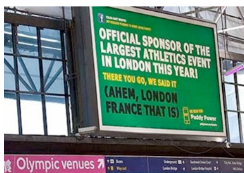
Figura 9 – Caso Paddy Power nos Jogos Olímpicos Londres 2012

Apesar do Comitê Olímpico Inglês ameaçar ajuizar um processo contra o site, sob o fundamento de que a publicidade infringia as normas por configurar marketing de emboscada, a decisão final foi no sentido de permitir a manutenção da campanha.